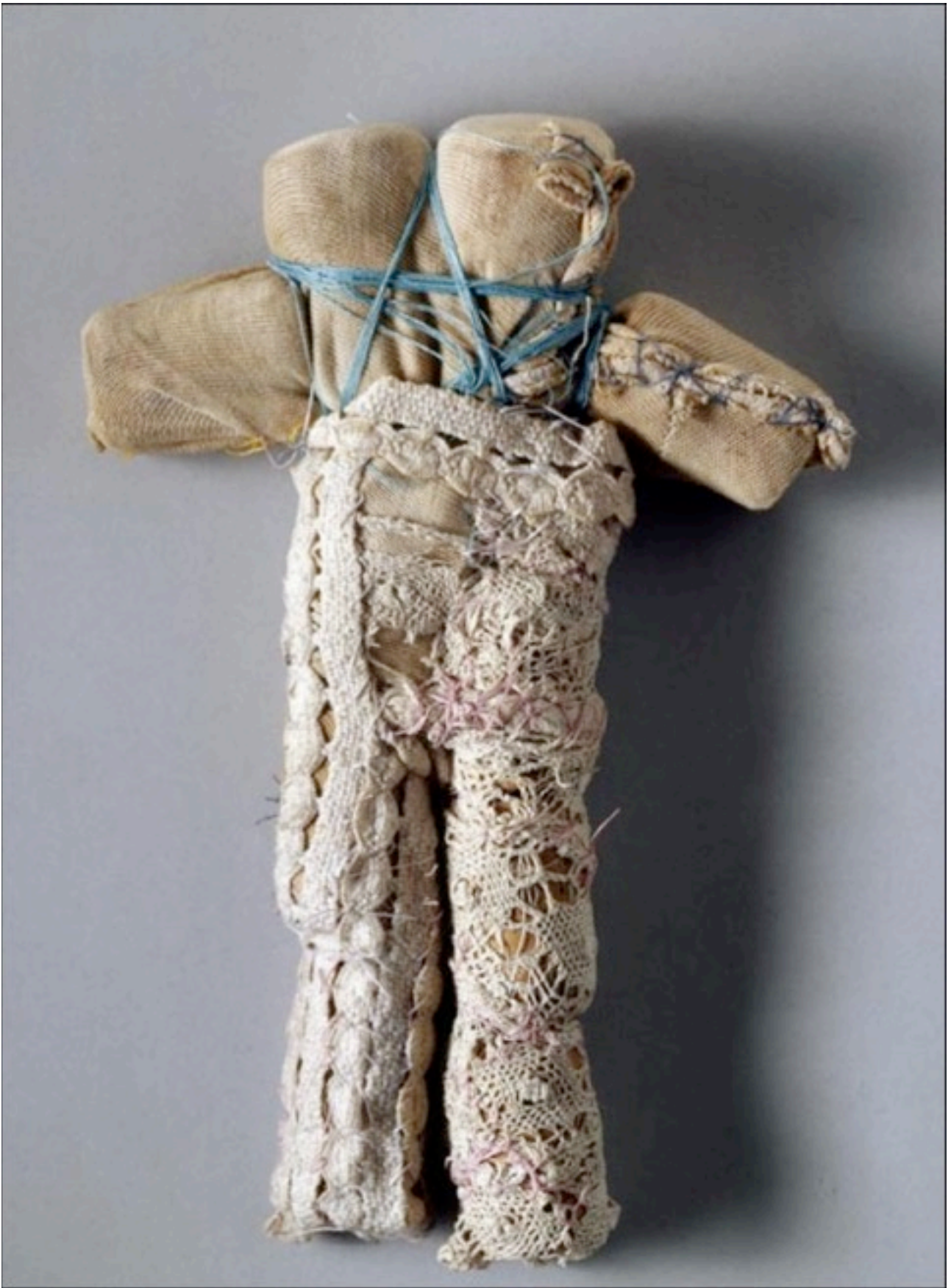
Louise Bourgeois, Zonder titel - 1996