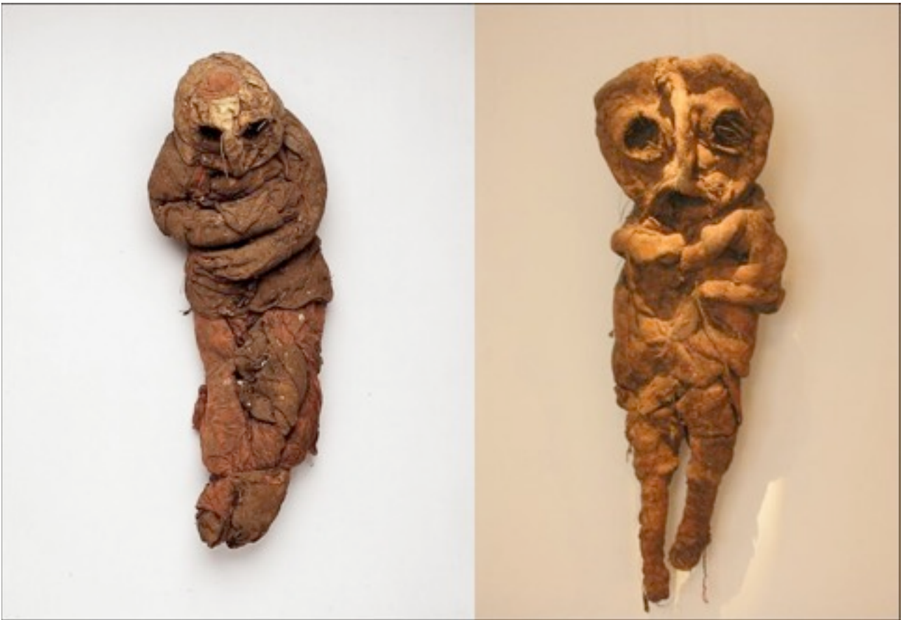
Michel Nedjar, Zonder titel (beide werken)