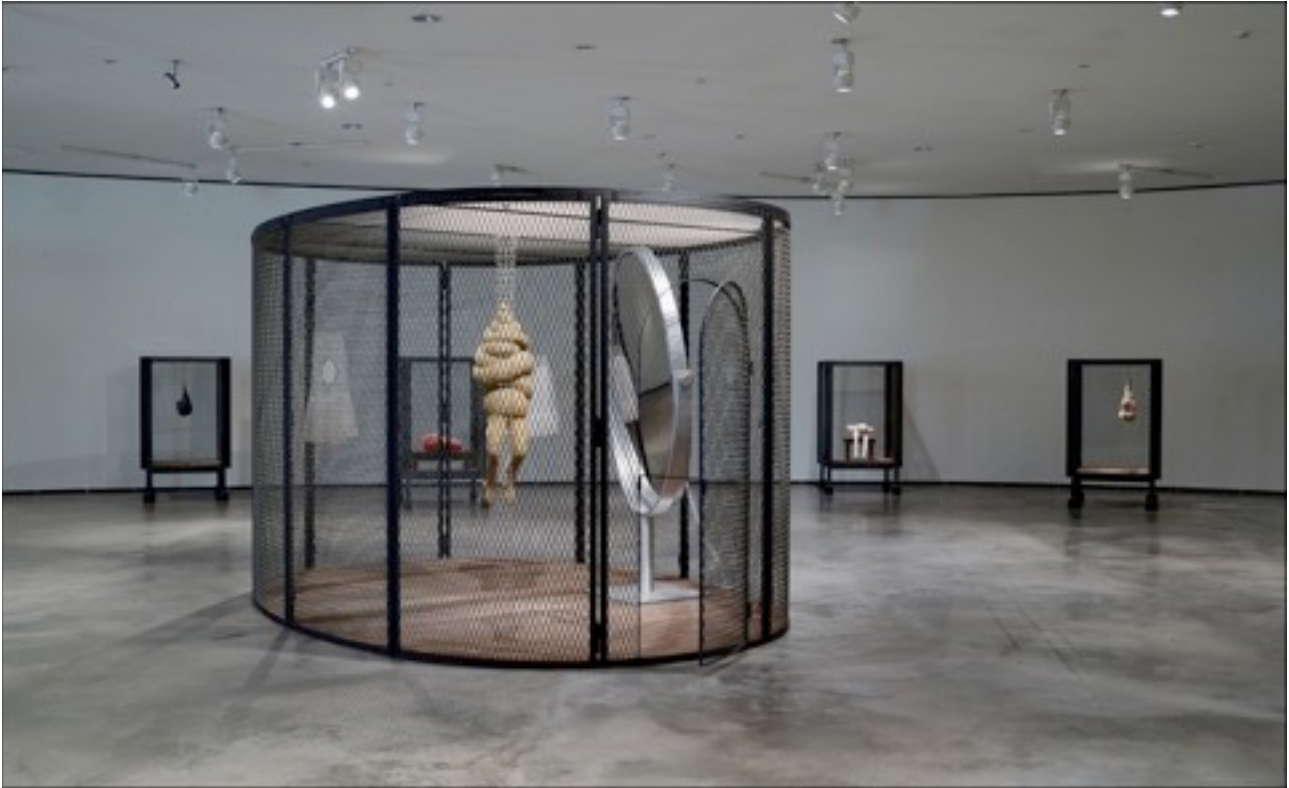
Louise Bourgeois, Cell XXVI - 2003

Nederland heeft er een museum bij. Met outsider art. Ik heb mij altijd afgevraagd wat een outsider artist is. Outsider zijn, is dat niet zoiets als je buiten een gangbare context plaatsen? Je onderscheiden met niet gangbaar werk, een niet gangbaar uiterlijk, niet gangbare gedachten? Maar, is dat niet wat voor alle kunstenaars geldt of op zijn minst zou moeten gelden?