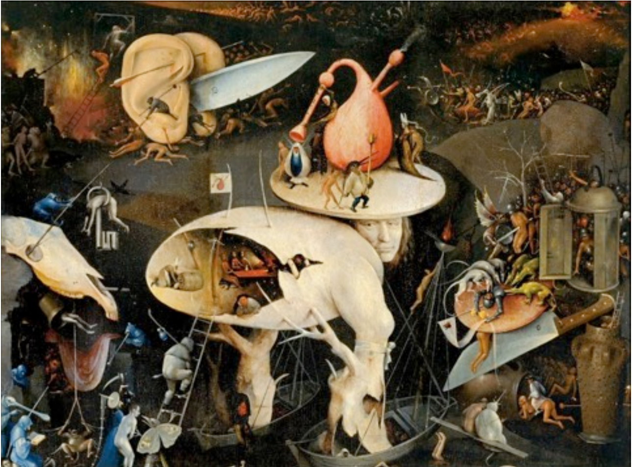
Jeroen Bosch - 1480-1490 | Detail uit het rechter zijluik van de "Tuin der Lusten"

Kant zou de esthetische ontroering die het bij ons opwekt toejuichen, want het kan worden toegedicht aan een 'vrije schoonheid' die voor zichzelf spreekt. De verbeelding en het gevoel zouden inherent zijn aan de vrije schoonheid en dit zou critici moeten bewegen tot een zuiver oordeel in plaats van tot een toegepast smaakoordeel. Maar hebben we hiervoor een subgroep nodig? Kortom, zijn niet alle kunstenaars die ertoe doen in beginsel outsiders?