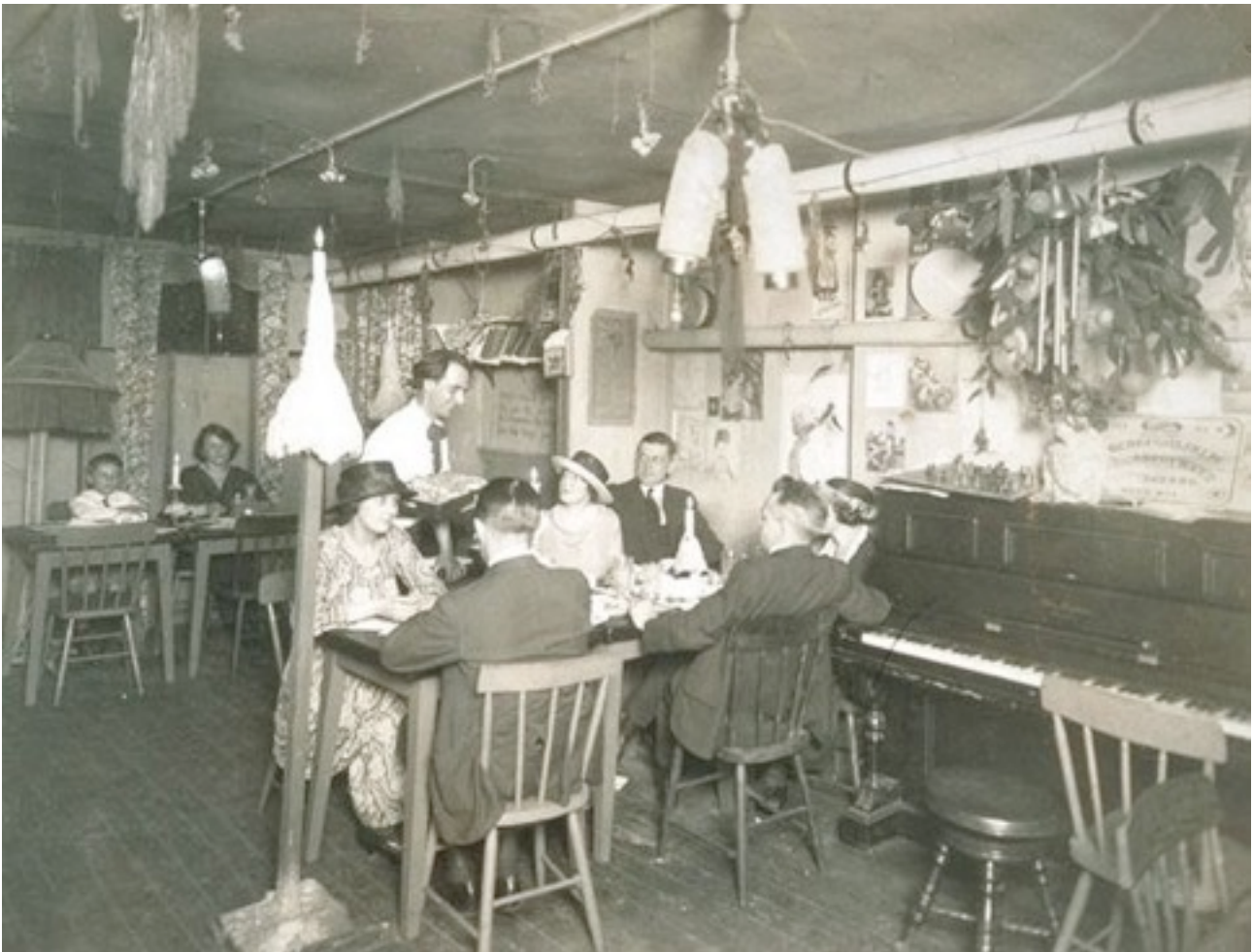
The Pepper Pot Café in Greenwich Village, Man Ray, Duchamps en andere kunstenaars ontmoetten elkaar hier met regelmaat