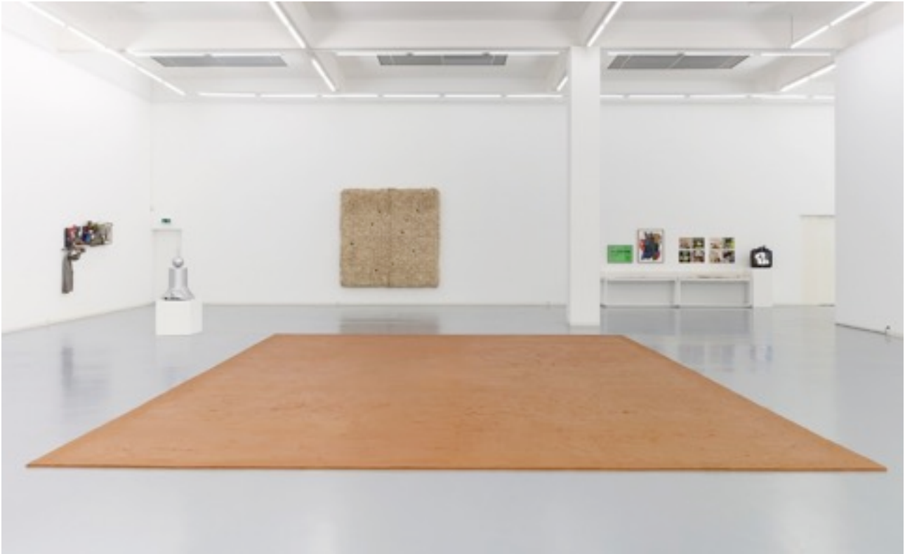
Wim T. Schippers' Pindakaasvloer, Bonner Kunstverein und Artothek Bonn

De jonge kunstenaar zal zich hier doorgaans niet in herkennen sinds hij of zij op de kunstacademie leerde vooral zijn of haar eigen ding te doen. De krampachtigheid die daaruit vaak ontstaat is hem of haar niet kwalijk te nemen. Maar ook oudere kunstenaars betrap ik op een oppervlakkigheid of lolligheid die de musea weliswaar uit het slop trekken en zelfs enkele critici weten te overtuigen, maar de kritische bohemiënen of laatsten der mohikanen vast de haren uit hun hoofden doen trekken.